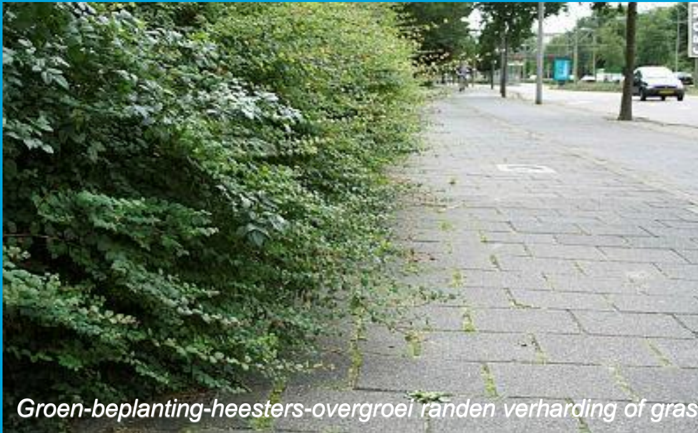
Groen-beplanting-heesters-overgroei randen verharding of gras